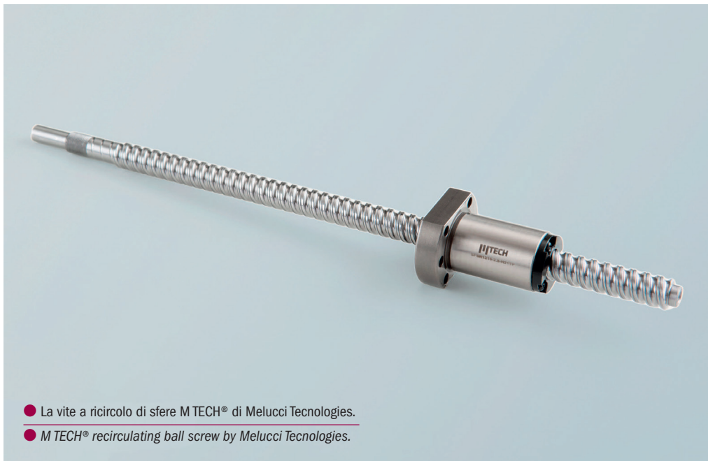
● La vite a ricircolo di sfere M TECH® di Melucci Technologies. ● M TECH® recirculating ball screw by Melucci Technologies.

Melucci Technologies consolida la propria presenza sul mercato della movimentazione lineare. Con il nuovo brand proprietario M-TECH®, caratterizzato da un interessante rapporto prezzo/qualità e dalla pronta disponibilità, l'azienda si pone come alternativa nel panorama nazionale.